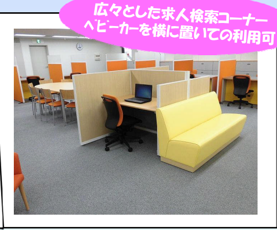
広々とした求人検索コーナー ヘビーカーを横に置いての利用可