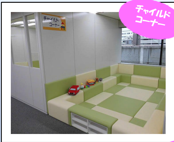
チャイルドコーナー