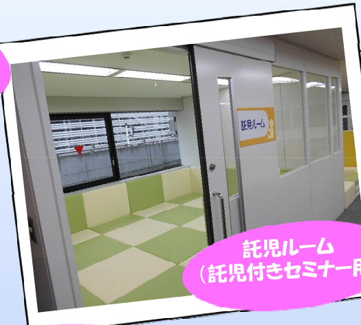
託児ルーム (託児付きセミナー用)