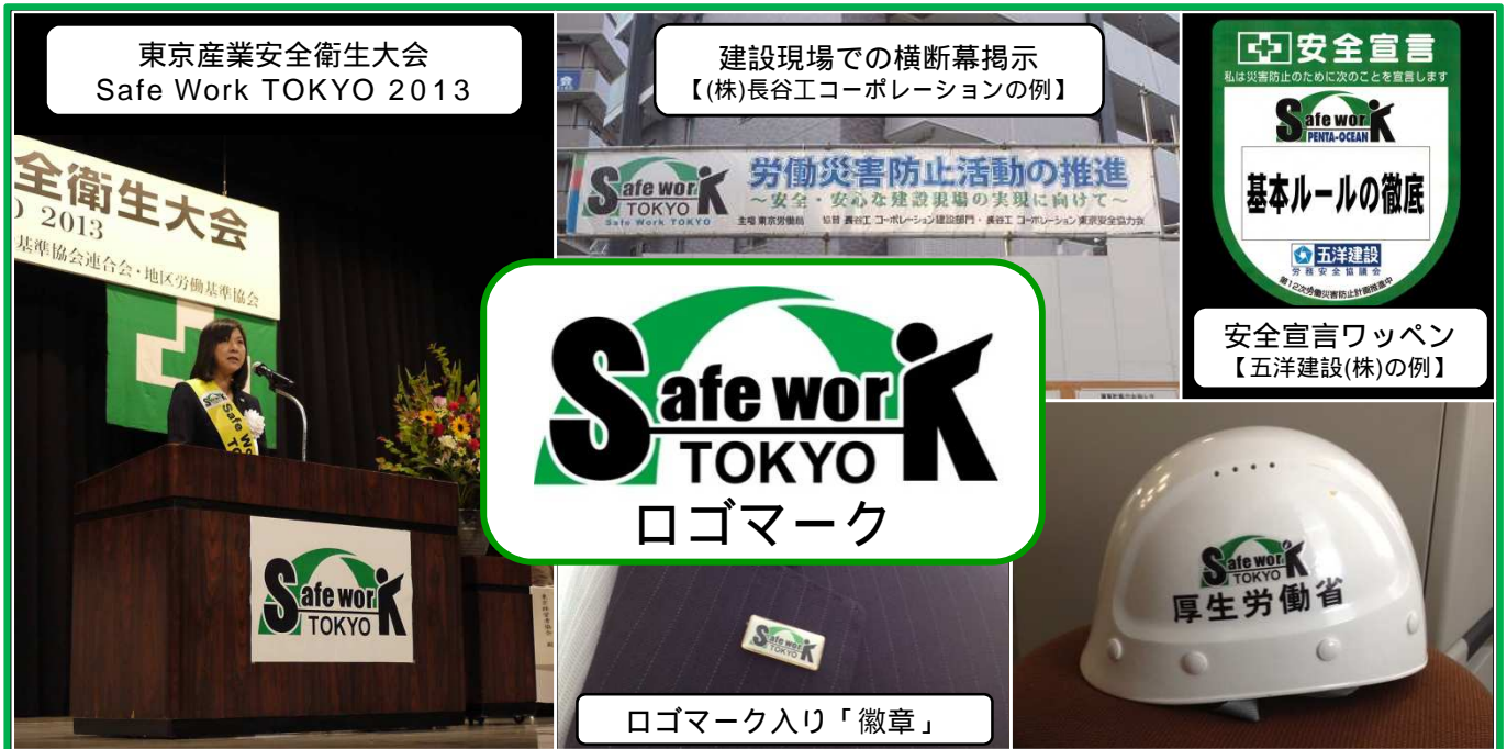
「Safe Work TOKYO」ロゴマーク活用例

「Safe Work TOKYO」をキャッチフレーズに 労働災害防止活動に取り組みましょう!