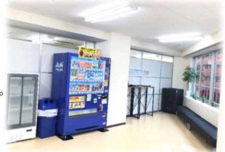
〈 評判の良い休憩室 〉

◆感染症防止対策に取り組んでいます アルコール消毒液の設置・共有部分の消毒・教室内の定期的な換気 等