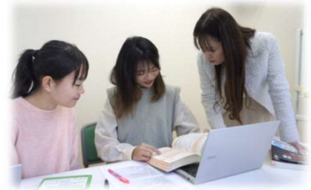
〈 わからないことは何でも聞いてください！ 〉