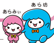
荒川区シンボルキャラクター