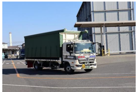
【走行中の無人トラック】