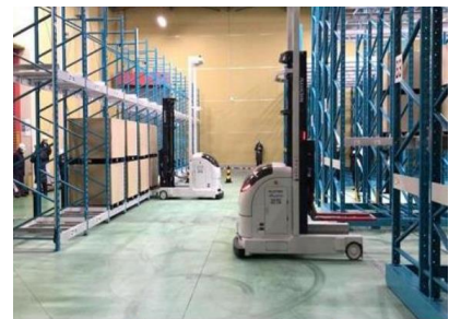
【無人フォークリフト】