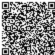
フォークリフト技能講習動画