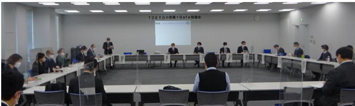
(※写真は、旧名称「TOKYO 小売業 + Safe 協議会」のもので)

本協議会においては、協議会メンバーである独立行政法人労働者健康安全機構労働安全衛生総合研究所の有識者による行動災害防止に関する講演を予定しており、転倒災害等の多い小売業の安全衛生に対する更なる気運醸成を推進することとしております。