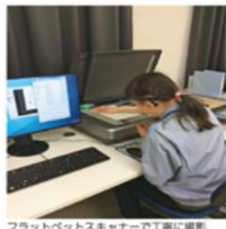
フラットベッドスキャナーで丁寧に撮影