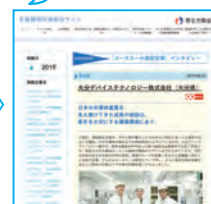
ユースエール認定企業の様子をチェック!