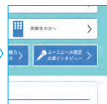
ボタンをクリック