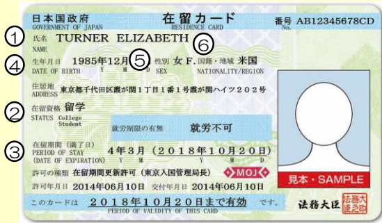
在留カード例（表面）