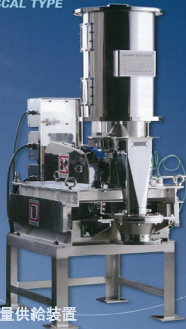
粉体定重量供給装置