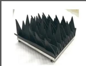
▲無響水槽用吸音ゴム