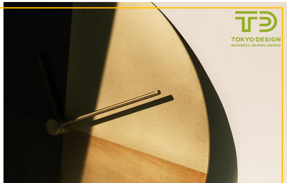
<ファクトリーブランドFUJIKINKOも展開中>

真鍮が一番美しいのはいつだろう？はじめは、初々しいはちみつ色に輝いている。時とともに琥珀色に変化し、奥ゆかしい色気を漂わせる。濡れたような光沢を帯び、触れば触るほど、うっとりするような滑らかな質感になっていく。