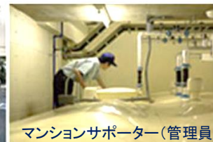
マンションサポーター(管理員)

大京アステージは家族の幸せを第一に考える お客様のために「居心地のよい住まい」と感じ ていただけるサービスを追求しています。