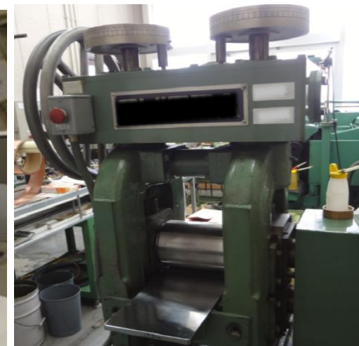
※金属箔を薄くする機械です