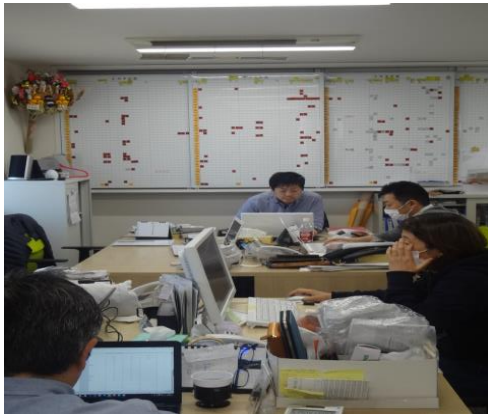
生産管理部門 仕事現場